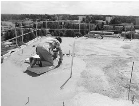
Kuva 3. Tekemällä yläpuolinen laatta nopeasti tiiviiksi estetään veden valuminen alempiin kerroksiin. Hyvin suunnitelluissa ja toteutetuissa kohteissa rakenteiden kuivuminen alemmissa kerroksissa on jo lähtenyt käyntiin, vaikka ylempiä kerroksia vielä valetaan.

Kun sisäilman ja ulkoilman välille saadaan riittävä lämpötilaero, sisäilman suhteellinen kosteus laskee merkittävästi. Valtaosan vuodesta pelkkä sisäilman lämmittäminen on riittävä keino laskemaan sisäilman suhteellinen kosteus alle tavoitellun 50 %:n. Talviaikaan, kun sisäil-